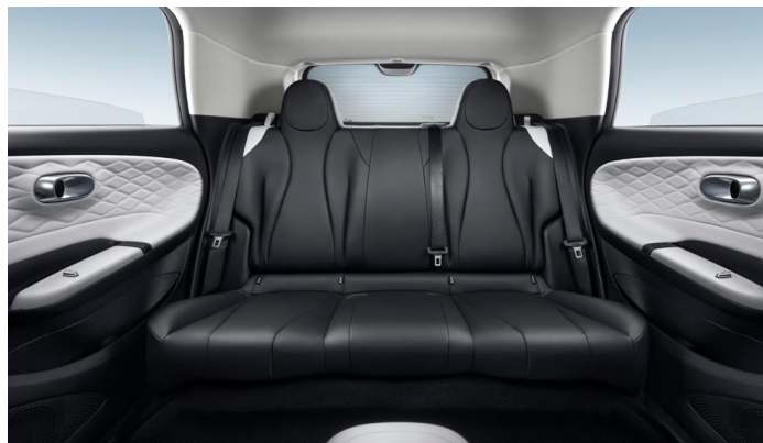
Рекордный запас пространства в В-классе