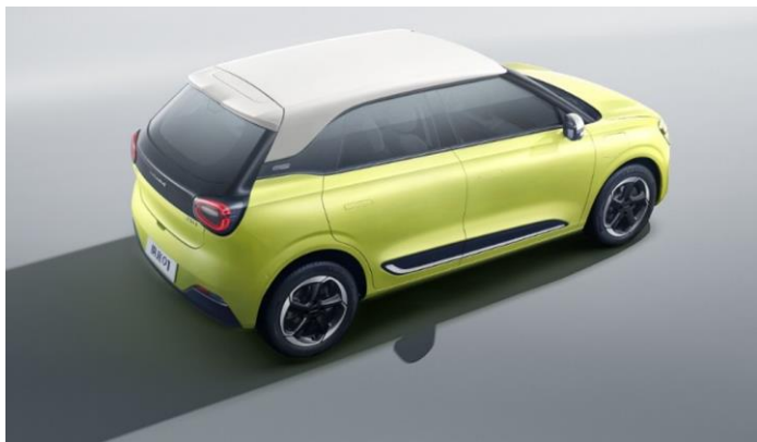
Двухцветный вариант исполнения экстерьера