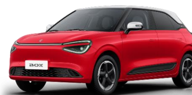
Красный (айвори крыша) (+ 3900 BYN)