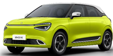
Жёлтый (айвори крыша)