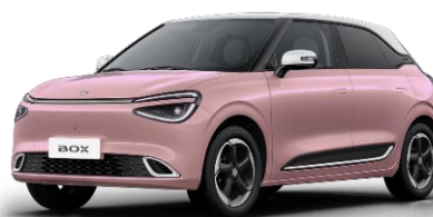
Бежевый (айвори крыша) (+ 3900 BYN)