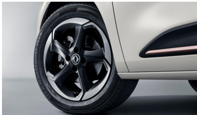
Легкосплавные диски 215/55 R17

Информация, представленная на данном листе, не является публичной офертой. Содержимое спецификации составлено на основе информации о состоянии конфигурации автомобиля на момент составления данного документа. Чтобы лучше удовлетворять потребности клиентов, производитель продолжает разрабатывать и совершенствовать автомобили. Некоторые конфигурации и характеристики моделей, продаваемых на рынке, могут отличаться от этой конфигурации. Для получения более подробной информации обращайтесь к авторизованным дилерам Dongfeng в Беларуси.