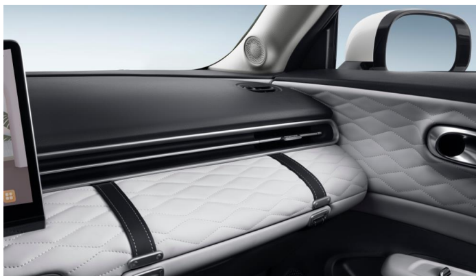
Премиальная отделка центральной консоли и дверных карт