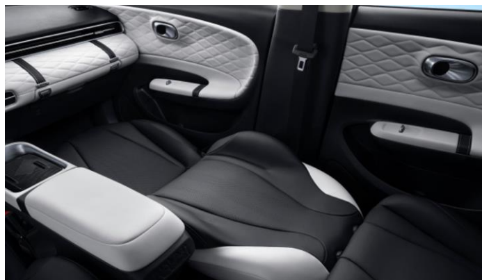
Трансформация передних сидений в ровный пол