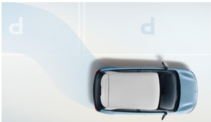
Система автоматической парковки