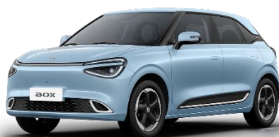
Голубой (+ 2800 BYN)