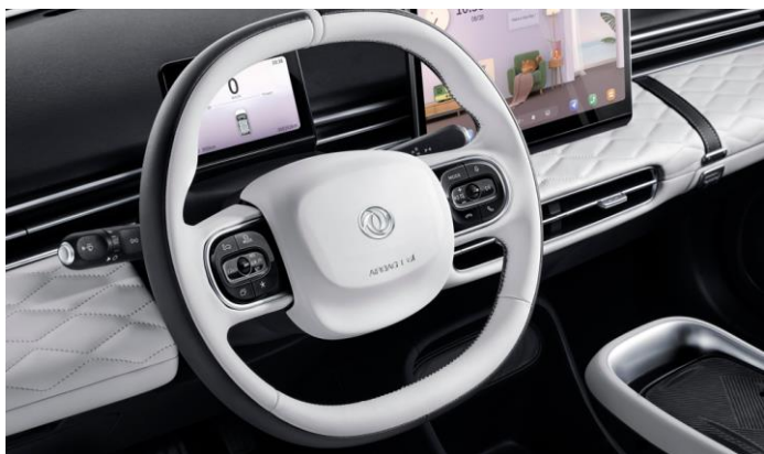
ACC адаптивный круиз-контроль с функцией интеллектуального автопилота