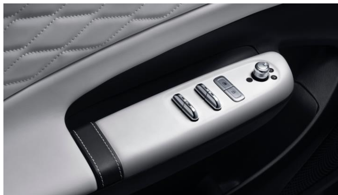
Интеллектуальные клавиши управления стеклоподъёмниками