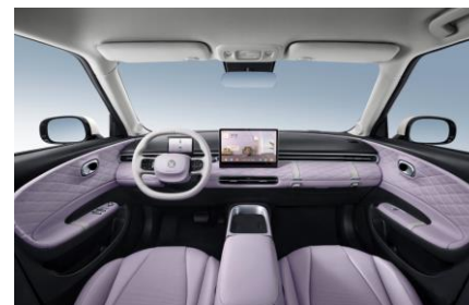
Светло-фиолетовый со светлыми элементами

Информация, представленная на данном листе, не является публичной офертой. Содержимое спецификации составлено на основе информации о состоянии конфигурации автомобиля на момент составления данного документа. Чтобы лучше удовлетворять потребности клиентов, производитель продолжает разрабатывать и совершенствовать автомобили. Некоторые конфигурации и характеристики моделей, продаваемых на рынке, могут отличаться от этой конфигурации. Для получения более подробной информации обращайтесь к авторизованным дилерам Dongfeng в Беларуси.