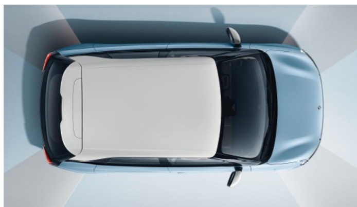
Система кругового обзора с 3D проекцией на 540°