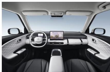
Чёрный со светлыми элементами