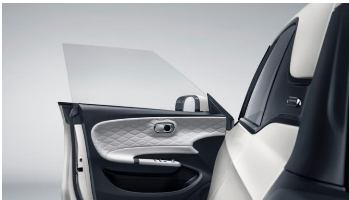
Безрамочные окна дверей