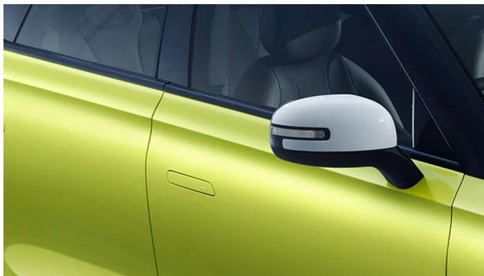
Автоматическое складывание наружных зеркал