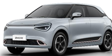
Серебристый (+ 1600 BYN)