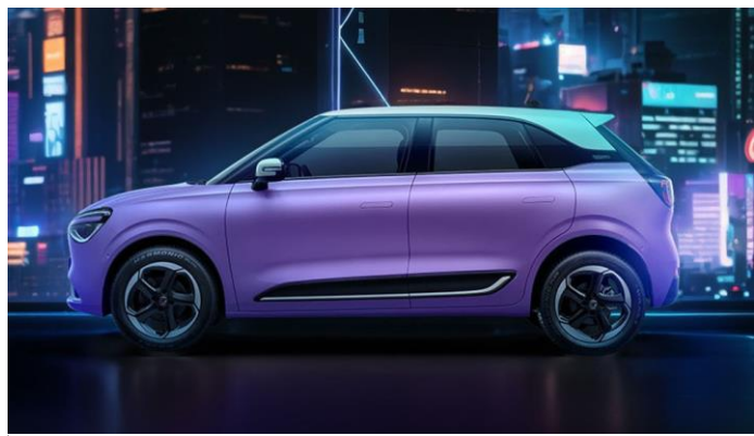
TSR система распознавания дорожных знаков