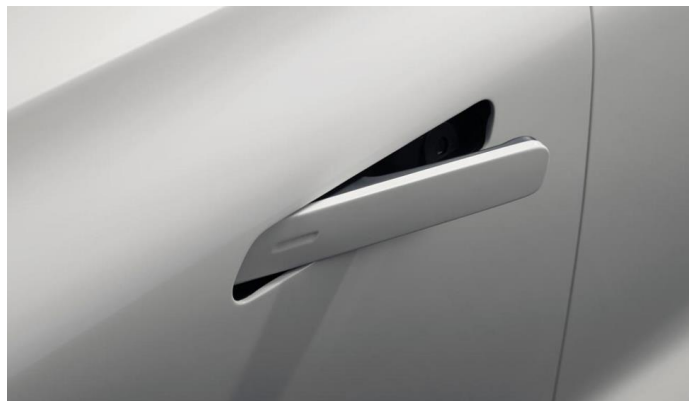
Выдвижные наружные ручки дверей, для лучшей аэродинамики