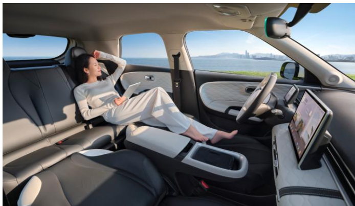
Трансформация передних сидений в зону релакса