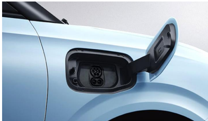
Зарядный порт CCS Combo со скоростью зарядки с 30 до 80% за 30 минут