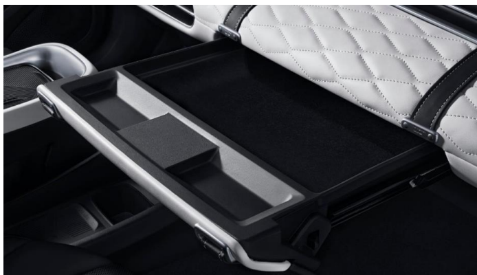
Многочисленные вещевые отделения