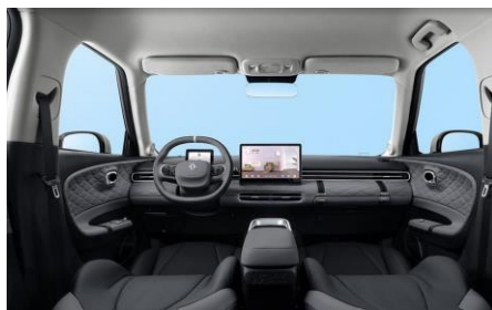
Тёмно-серый с серыми элементами