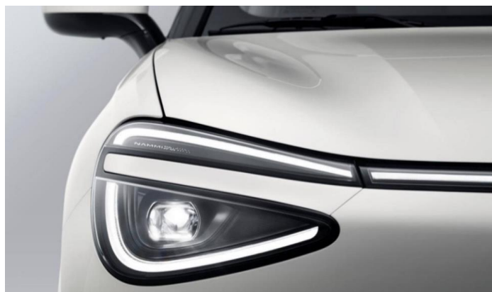
LED-оптика с системой автопереключения ближнего-дальнего света

Информация, представленная на данном листе, не является публичной офертой. Содержимое спецификации составлено на основе информации о состоянии конфигурации автомобиля на момент составления данного документа. Чтобы лучше удовлетворять потребности клиентов, производитель продолжает разрабатывать и совершенствовать автомобили. Некоторые конфигурации и характеристики моделей, продаваемых на рынке, могут отличаться от этой конфигурации. Для получения более подробной информации обращайтесь к авторизованным дилерам Dongfeng в Беларуси.