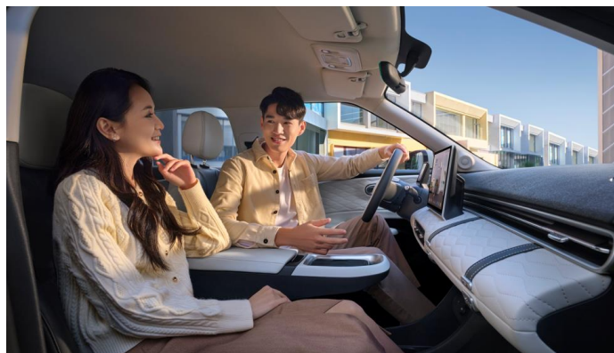
Обогрев и вентиляция сиденья водителя