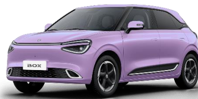
Фиолетовый (+ 2000 BYN)