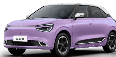
Фиолетовый (айвори крыша) (+ 2500 BYN)