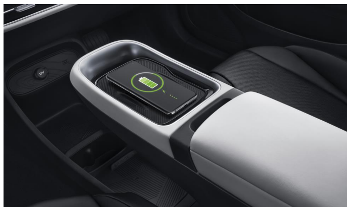
Беспроводная зарядка для смартфона с дополнительной вентиляцией

Информация, представленная на данном листе, не является публичной офертой. Содержимое спецификации составлено на основе информации о состоянии конфигурации автомобиля на момент составления данного документа. Чтобы лучше удовлетворять потребности клиентов, производитель продолжает разрабатывать и совершенствовать автомобили. Некоторые конфигурации и характеристики моделей, продаваемых на рынке, могут отличаться от этой конфигурации. Для получения более подробной информации обращайтесь к авторизованным дилерам Dongfeng в Беларуси.