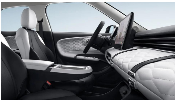
Автоматический климат-контроль со стилизованными воздуховодами